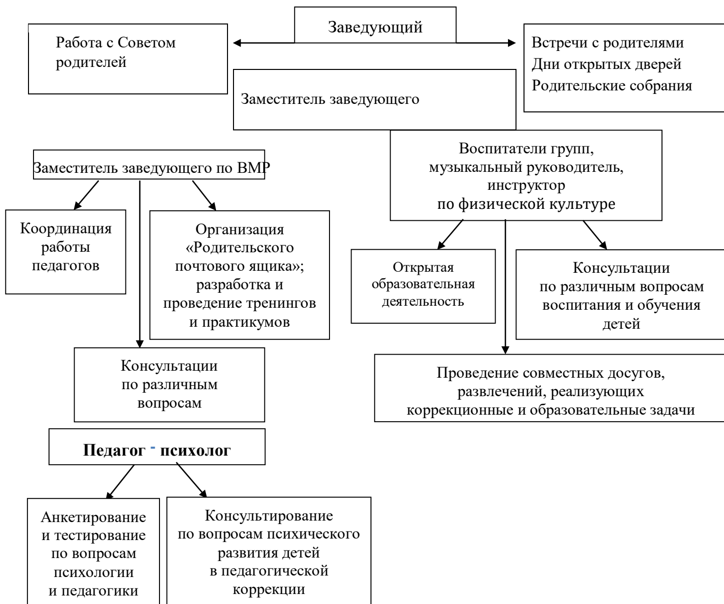
Рис. 1 «Схема взаимодействия с семьями воспитанников»